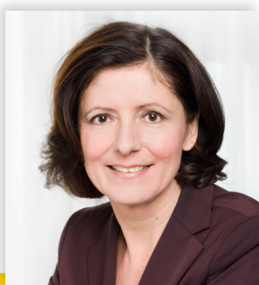
Ministerpräsidentin Malu Dreyer

Demokratie kann auf vielfältige Weise gestaltet und gelebt werden. Ob in der Schule oder im Freundeskreis, ob im Sportverein oder in Eurer Stadt: Am Schönsten ist es, sich gemeinsam mit Freunden und Freundinnen für eine gerechtere und bessere Welt einzusetzen. Damit gestaltet Ihr mit und Demokratie bleibt lebendig. Demokratie ist auch, dass Ihr früh lernt Verantwortung für Euch und für Euer Umfeld zu übernehmen und dass Ihr wichtige Entscheidungen in Eurem Leben mitbestimmen könnt.